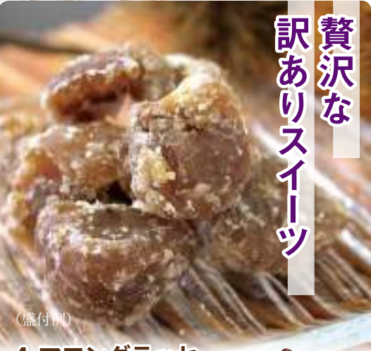
4. マロングラッセブローケン (手提げ袋入)